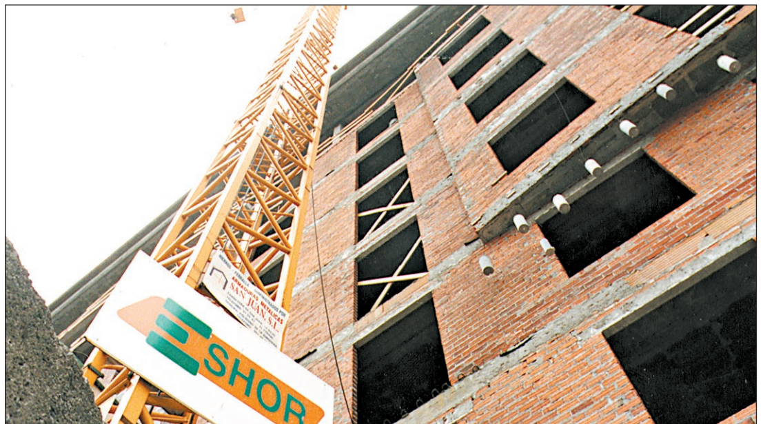
La firma, afincada en Fene, cuenta con una plantilla de más de 450 trabajadores

Otro de los departamentos se dedica al alquiler y venta de