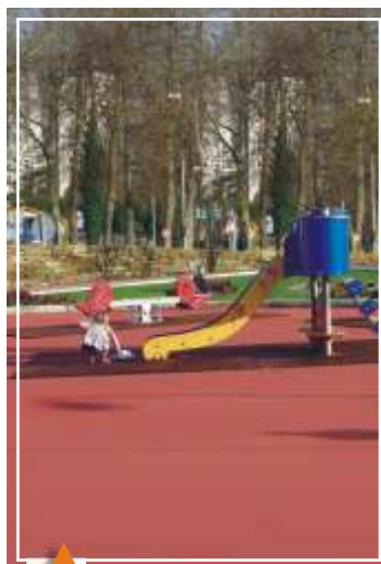
En parques infantiles. Modelo: HORMIGÓN PULIDO Color: ROJO