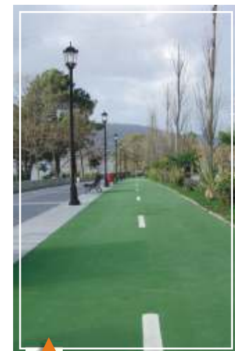
En avenidas y paseos. Modelo: HORMIGÓN PULIDO Color: VERDE