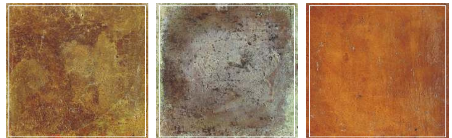
Soleras con un tratamiento uniforme, imitando a baldosas mediante cortes en su superficie, o recreaciones tipo "mosaico"

Es un proceso rápido si se necesita tratar por un igual una superficie, o un proceso más elaborado si mediante esta técnica se quieren representar en el pavimento formas concretas, combinando colores y texturas.