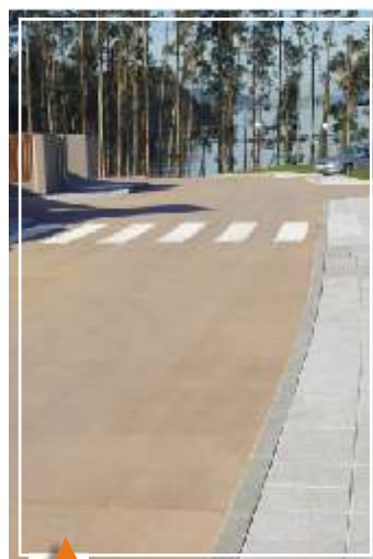
En calles y plazas. Modelo: HORMIGÓN PULIDO Color: PARDO CLARO

Las muestras de color representadas en esta página son reproducciones y pueden diferir de los verdaderos.