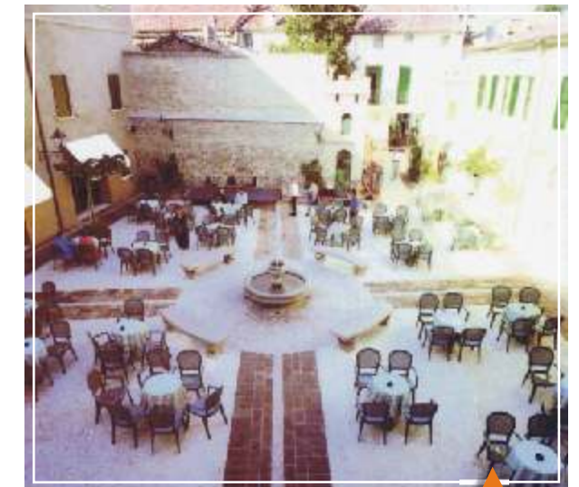
Un ambiente de distinción en todo su esplendor.