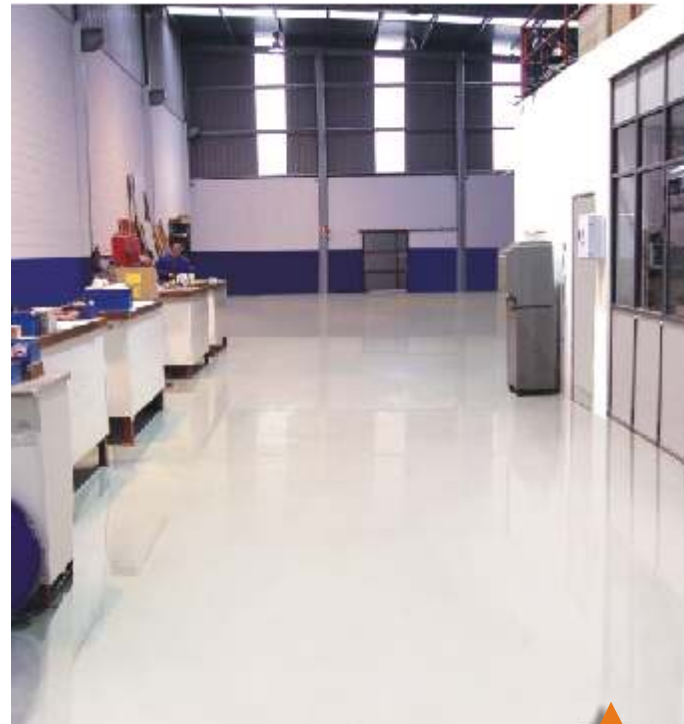
Aspecto del pavimento una vez tratado.

COMPRUEBE COMO EN UN PLAZO DE 24 HORAS UN SUELO DETERIORADO SE TRANSFORMA EN UN SUELO PERFECTAMENTE LISO Y 6 VECES MÁS RESISTENTE AL DESGASTE QUE UN PISO DE HORMIGÓN.