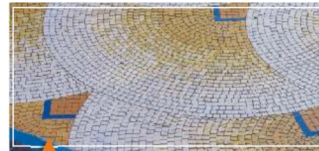
La combinación de colores permite una infinidad de motivos adaptados a cada situación.

Resulta un producto de alta calidad, rápido montaje de un acabado impecable, y reducidos costes de mantenimiento ya que puede ser tratado anti mancha.