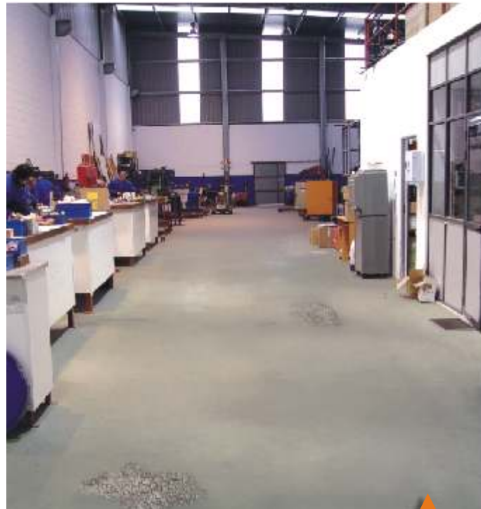
Estado del pavimento antes del tratamiento.

Consumo: aprox. 1,2 Kg/m 2 por mm. De espesor.